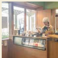
イートイン側のカウンター

シェアデパートメント稲城長沼内でお買い物をされたお客様、および施設利用者向けのトイレです。トイレのみのご利用はお断りしております。