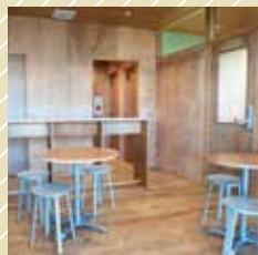
丸い机が置いてあるお部屋です。

施設利用者の交流の場とイートインスペースです。こちらは、シェアデパートメント稲城長沼内の飲食店でお買い上げいただいた商品を飲食していただけます。シェアキッチンが開いている場合は扉が開放されていますので、自由にご利用いただけます。鍵が閉まっている日でも、シェアデパートメント稲城長沼内の店舗でお買い物されたお客様がご希望の場合、各店舗のスタッフにお声がけください。鍵を開けて対応いたします。イートインスペースではゴミ箱の設置はございません。お手数ですが、ご自身でゴミをお持ち帰りいただくか、お買い物をしたお店にお返しください。