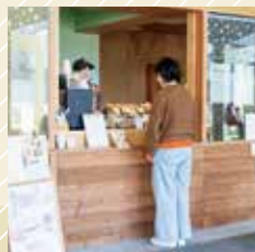
広場側の大きな窓のあるお店です。

こちらは日替わりで出店者が入れ替わるスペースとなっています。広場側のカウンターとイートイン側のカウンターでそれぞれ異なる店舗が出店している日もございます。お気に入りの出店者を見つけた場合は、窓の横にあるカレンダーで出店日をご確認ください。出店者がいない日は閉まっていることもありますのでご了承ください。